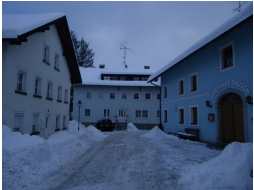
30. Januar 2010 – links im Bild das ehemalige Baderhaus und rechts das „Schreiner-gasthaus“ zuletzt Breitschopf, 2020 abgerissen.

Aber auch als keine ungarischen Ochsen mehr ins Reich getrieben wurden, handelte es sich um eine wichtige Verbindung der Garnmärkte zwischen den Landgerichten Wegscheid, Wolfstein und Grafenau. So argumentierte jedenfalls das königliche Landgericht Wolfstein im Bericht an die königliche Regierung von Niederbayern, als die Heibl-mühlbrücke über die Wolfsteiner Ohe am 26. April 1841 durch Hochwasser schwer beschädigt wurde und es um die Kosten der Wiederherstellung ging. Die Straße wurde damals als Distriktstraße (Kreisstraße) eingestuft. Als dann nach dem 2. Weltkrieg von den Ochsenfuhrwerken auf Motorfahrzeuge umgestiegen wurde, war dieses Straßenstück, vor allem im Winter ein ständiger Gefahrenort. Noch um 1960 befand sich dort