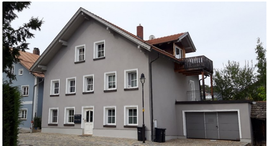
Das Anwesen wurde erst kürzlich renoviert und steht Beschäftigten des Hotels Jagdhof als Unterkunft zur Verfügung.